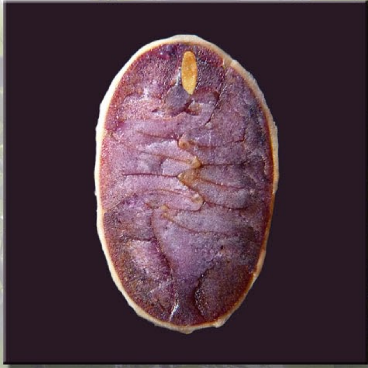
Fève de cacao et son embryon