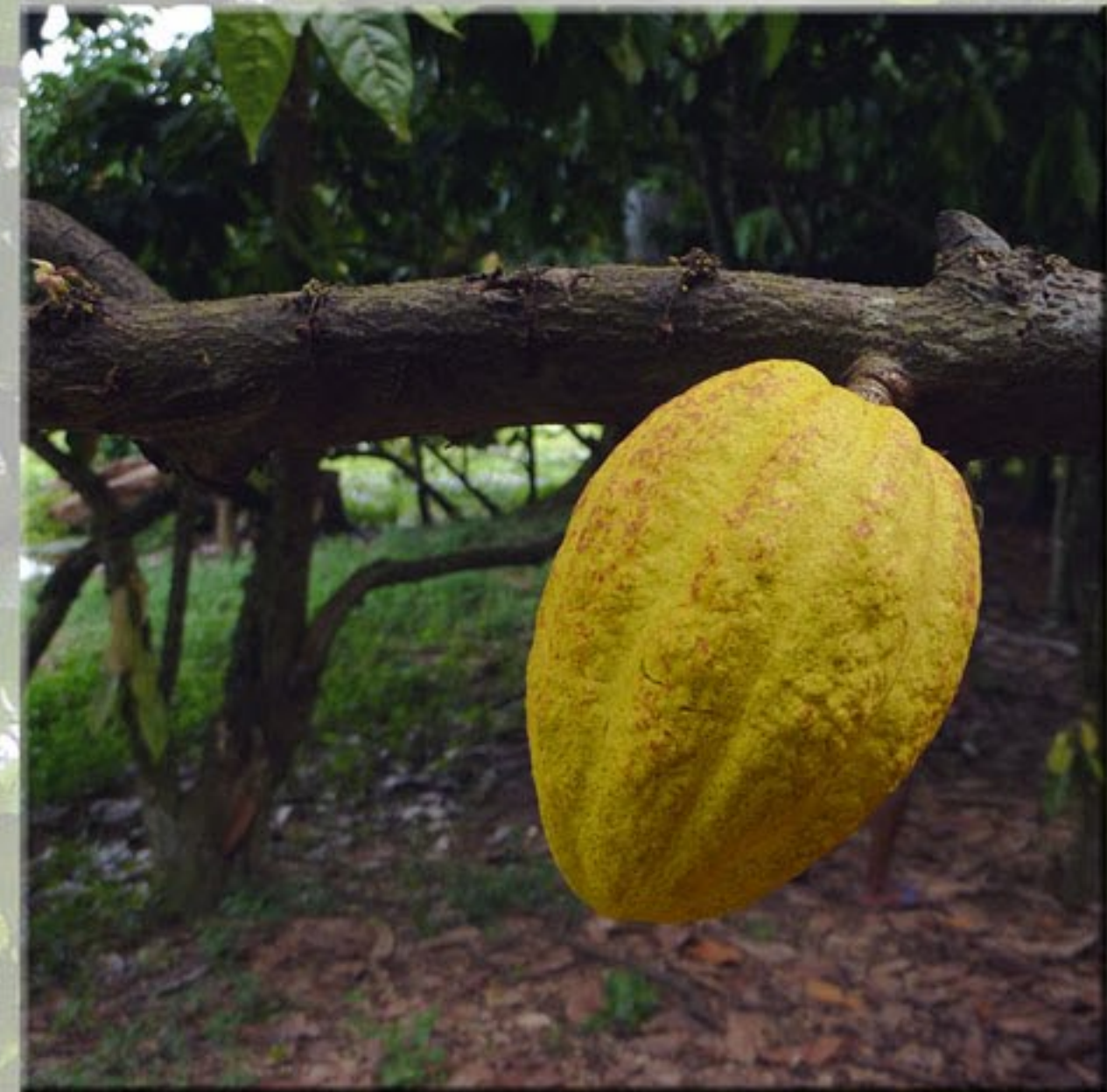
Cabosse de cacao forastero