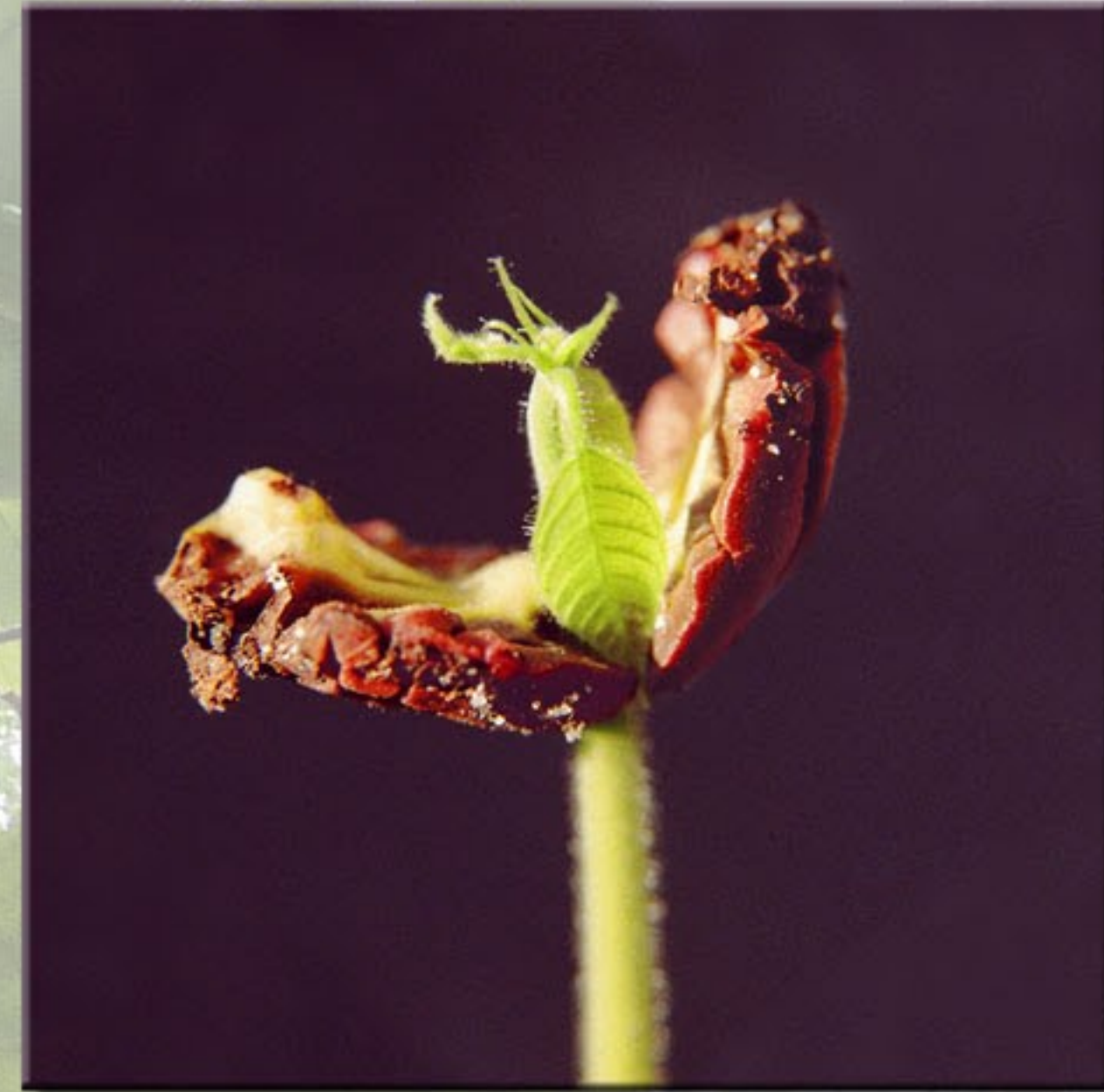
Germination d'une fève