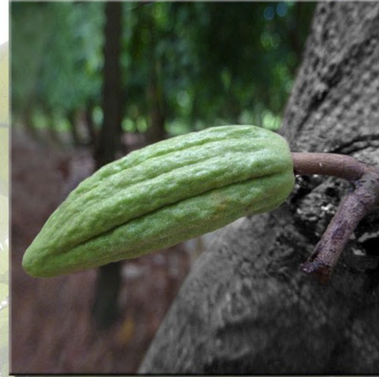
Cherelle, petite cabosse