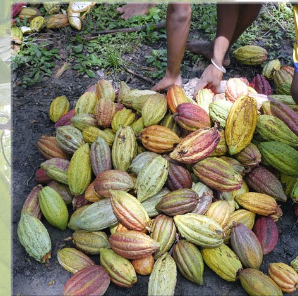
Récolte des cabosses