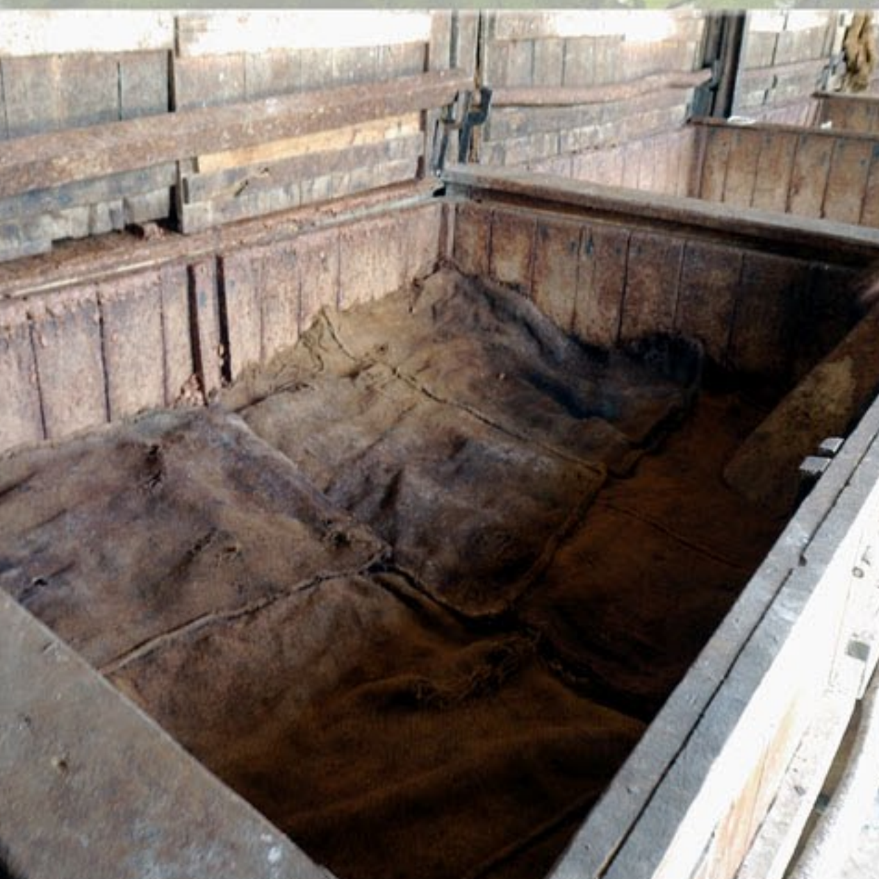
Fermentation des fèves