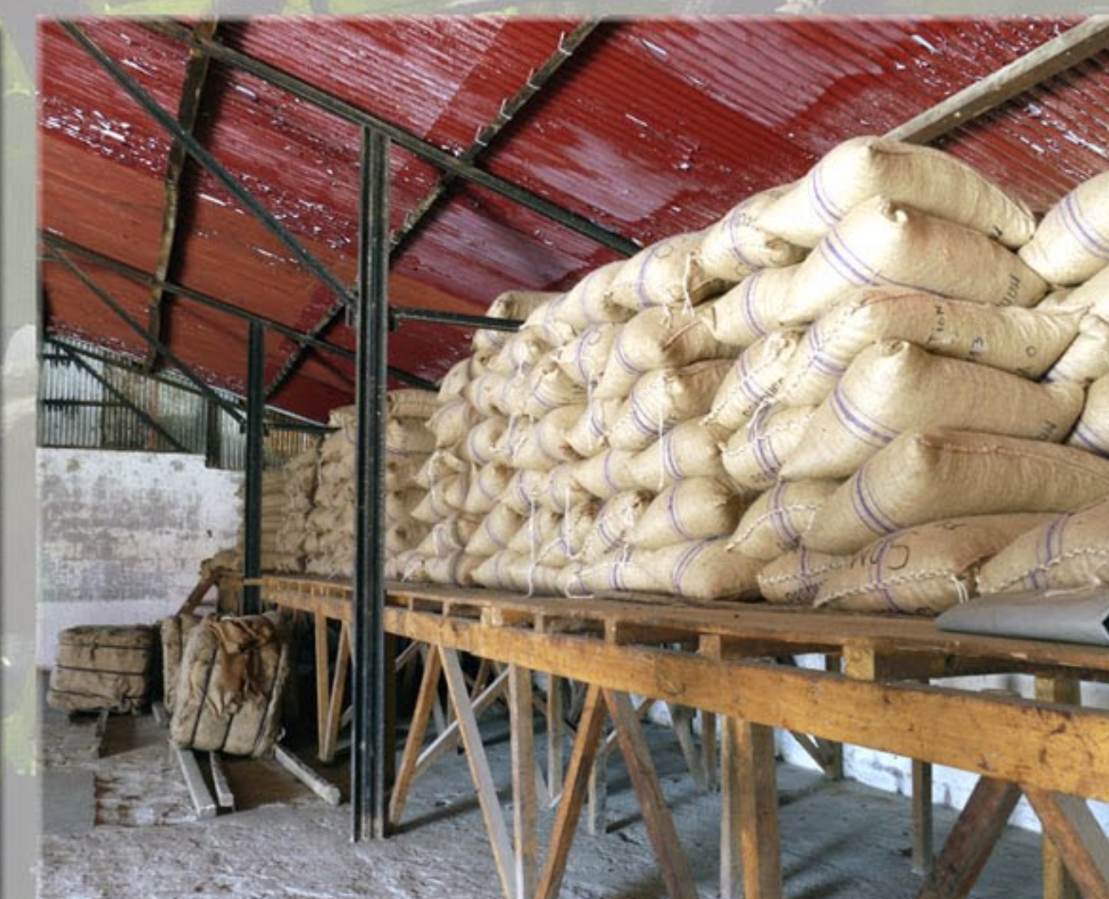
Stockage des fèves de cacao