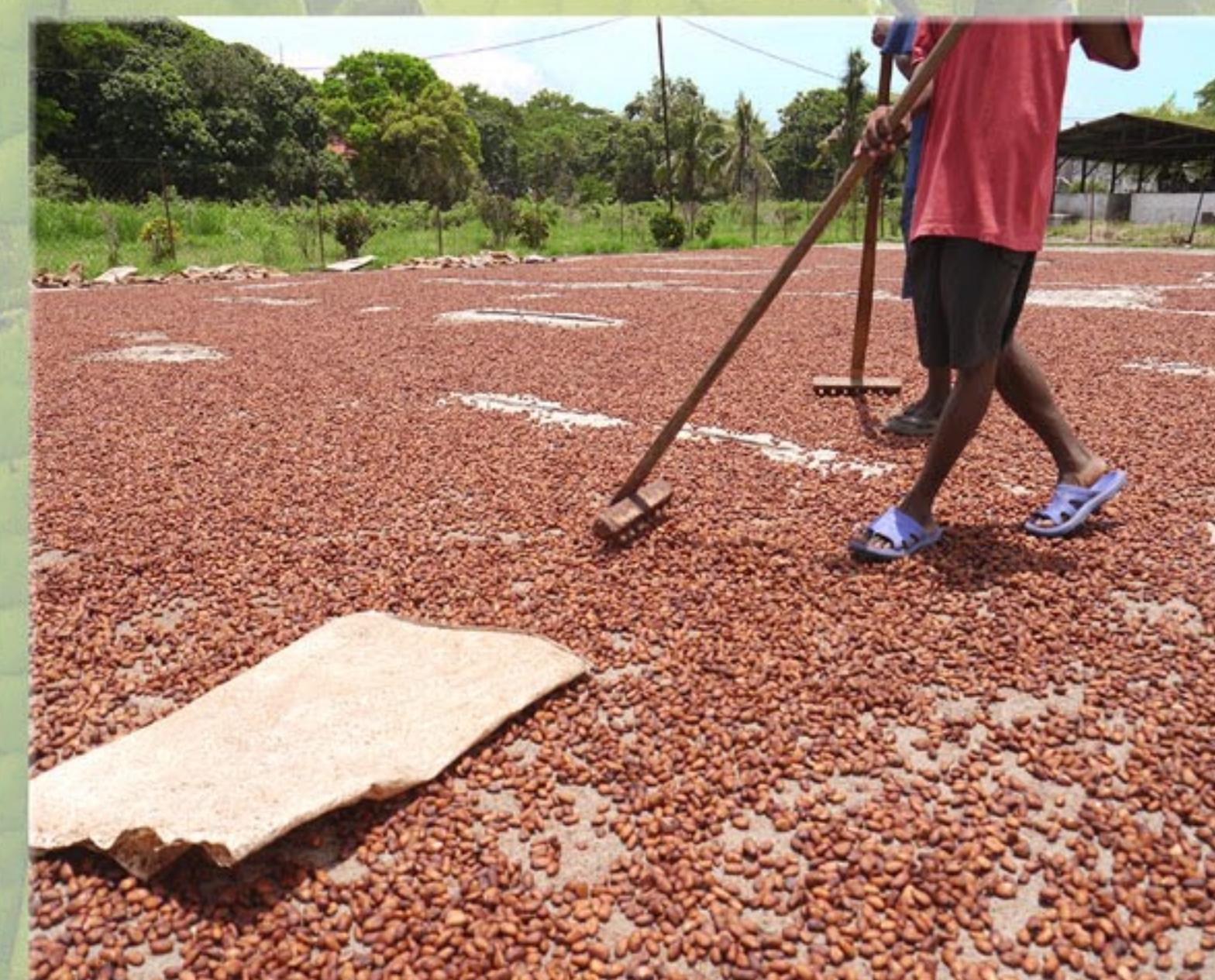
Brassage des fèves au grand soleil