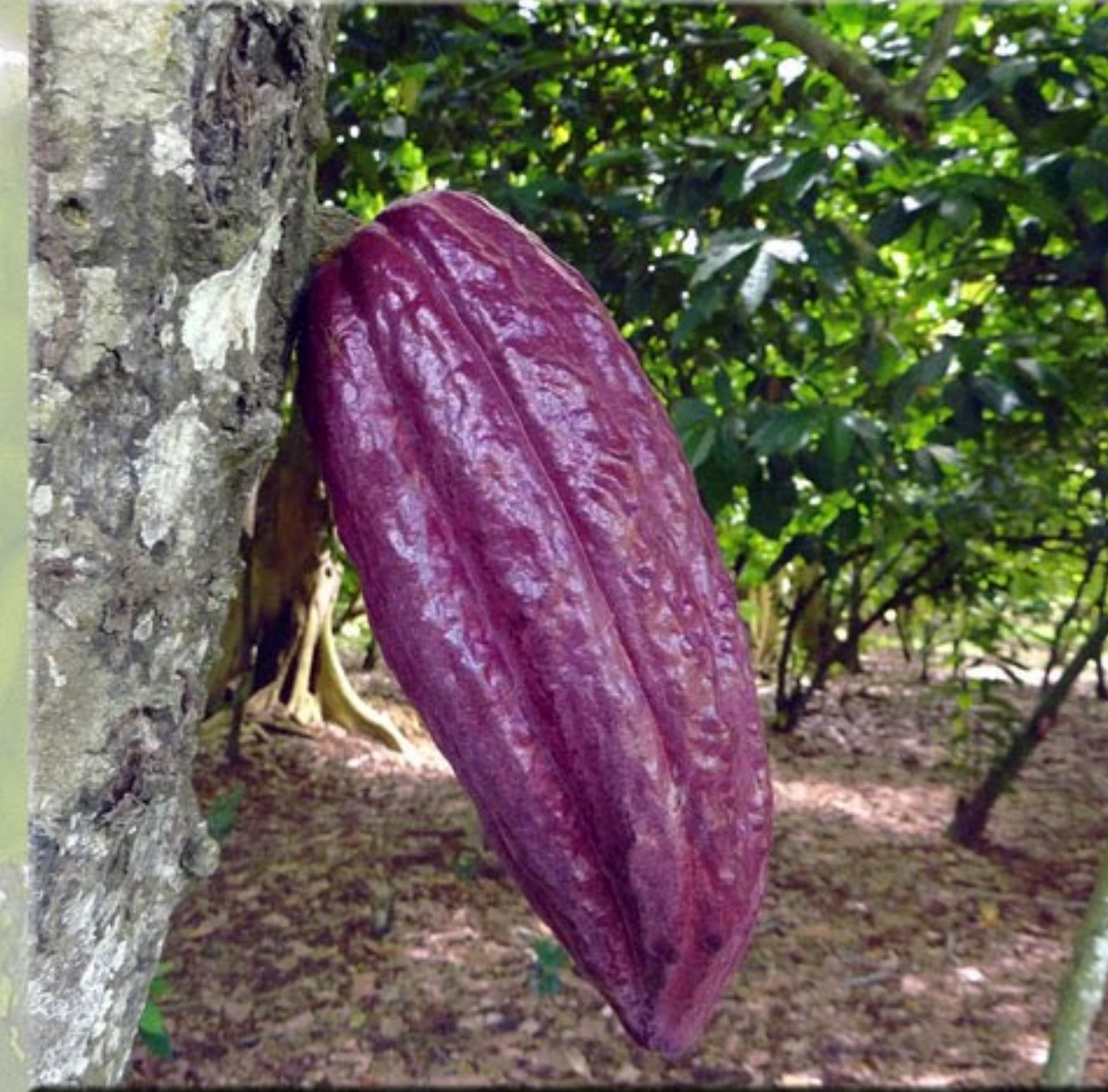
Cabosse de cacao trinitario