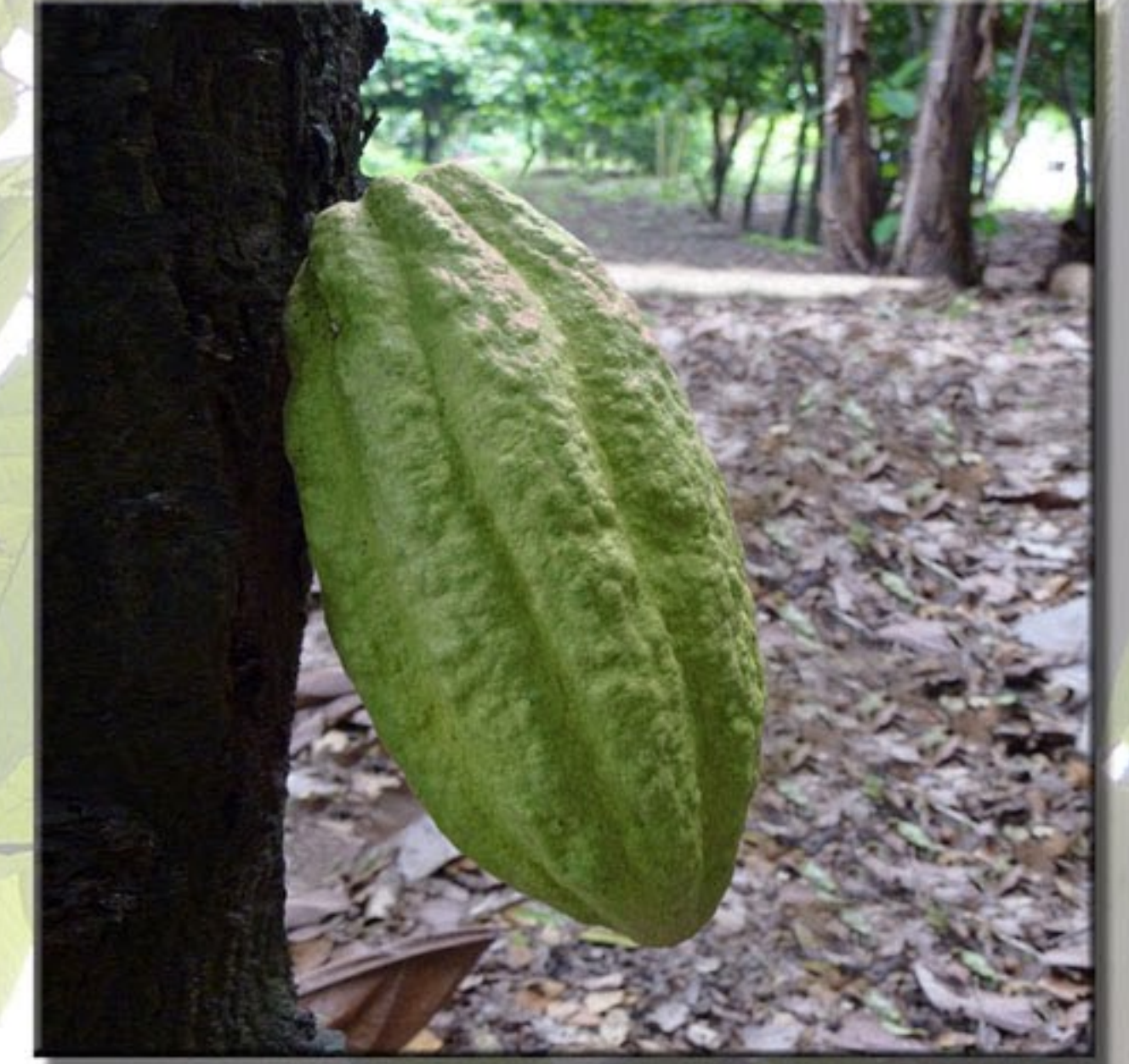
Cabosse de cacao criollo