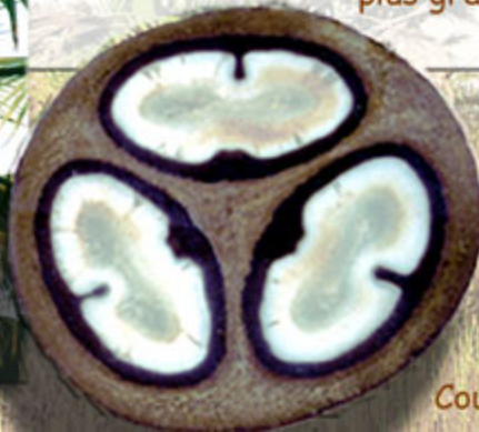
Coupe d'un fruit frais